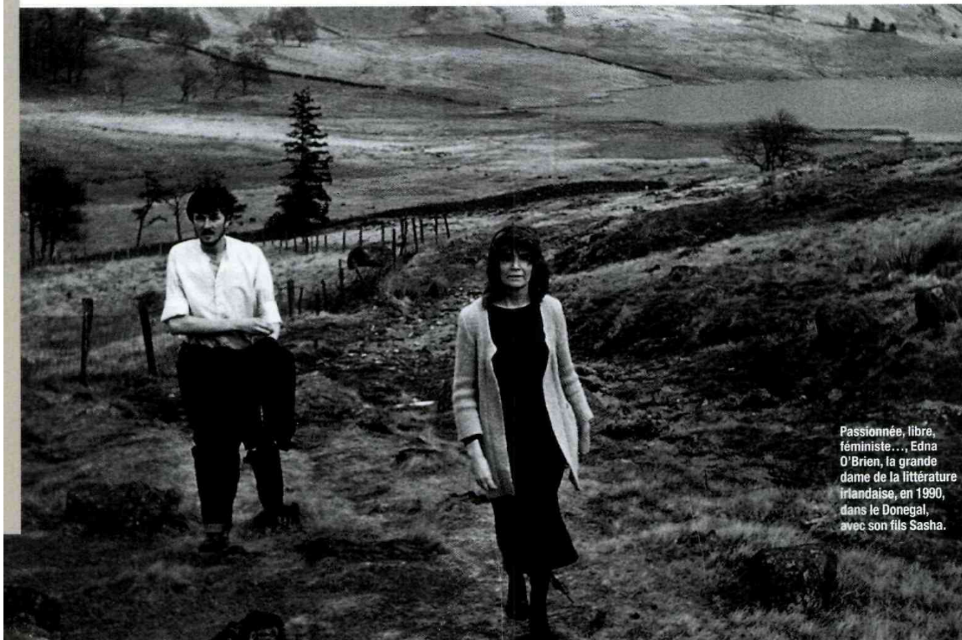
Passionnée, libre, féministe..., Edna O'Brien, la grande dame de la littérature irlandaise, en 1990, dans le Donegal, avec son fils Sasha.

près de quatre décennies, des romans ou des nouvelles – une forme littéraire très prisée sur l'île – font voler en éclats l'image un peu trop carte postale de « la verte Érin ». La nouvelle génération a à cœur d'en montrer l'autre visage, plus complexe qu'il y paraît : celui d'une terre déchirée par la violence, les séparatismes religieux et sociaux, hantée par le carcan de l'intolérance ou de la