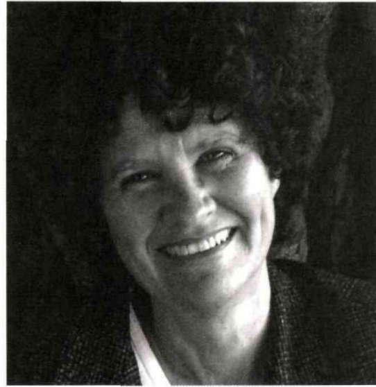
◇ LITTÉRATURE ÉTRANGÈRE | FIONA KIDMAN & KATE GRENVILLE ◇

Une terrible infection me cloue au lit, mon séjour à Rome est annulé : noir, c'est noir ! En attendant des jours meilleurs, je débranche le téléphone et m'enterre sous ma couette avec une pile de romans historiques. Embarquement immédiat pour un voyage dans le passé à l'autre bout du monde : l'Océanie m'attend.