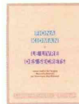
Fiona Kidman Le Livre des secrets Traduit de l'anglais (Nouvelle-Zélande) par Dominique Coy-Blanquet Sabine Wespieser 482 p., 25 €

► Lus & conseillés par M. Clesse Lib. Ducher Plein ciel (Verdun) E. Eviciani Lib. Le BHV-Marais (Paris) M.-L. Turoche Lib. L'Écriture (Vaucresson) C. Busalli Lib. du Tramway (Lyon)